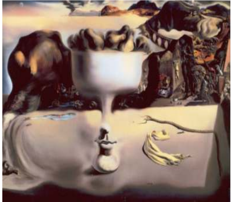
Aparició d'un rostre i d'un fruiter a la platja (1938). Salvador Dalí (1904-1989)

Ara torna a observar el quadre i busca la figura d'un caçador força gran (gairebé ocupa de punta a punta del quadre). Quan l'hagis trobat, digues quina relació hi ha entre el pel del seu lloç i les figues del fruiter.