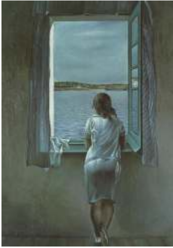
L'al.lota a la finestra 1925