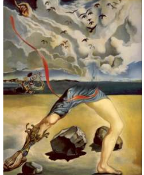
Paisatge fantàstic: migdia heroic (1942). Salvador Dalí (1904-1989)